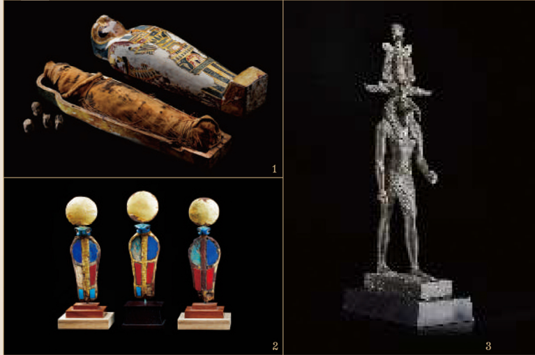
1.ホルスの4人の息子たちの護符とプタハ・ソカル・オシリス神のミイラ/末期王朝～プトレマイオス朝時代 2.ウラエウス厨子装飾/新王国時代・第18王朝 3.アテフ冠を被ったトト神像/末期王朝～プトレマイオス朝時代