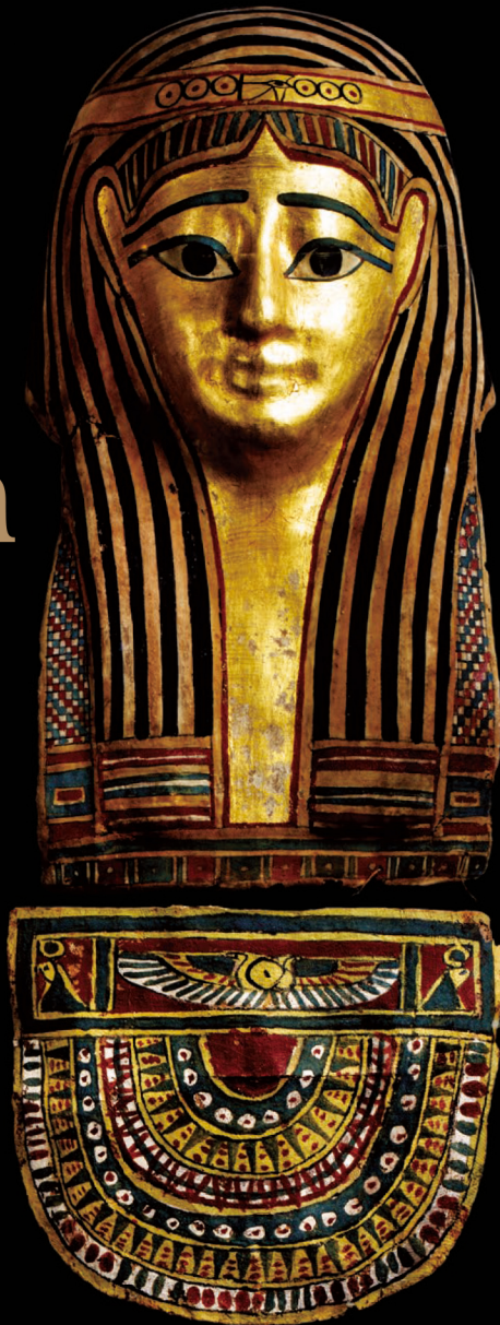
ミイラマスク/ブトレマイオス 複製代 Mummy mask and covers