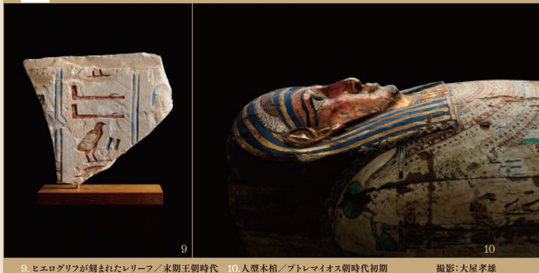
9.ヒエログリフが刻まれたレリーフ/末期王朝時代 10.人型木棺/プトレマイオス朝時代初期