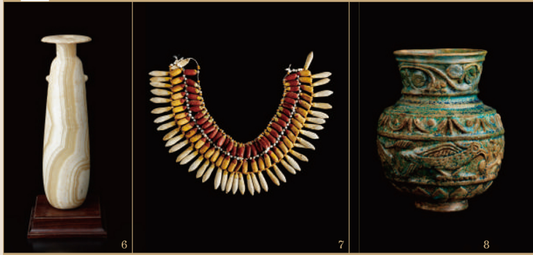
6.アラバストロン/末期王朝～プトレマイオス朝時代 7.花をモチーフにした胸飾り/新王国時代 8.レリーフ装飾のある容器/ローマ支配時代