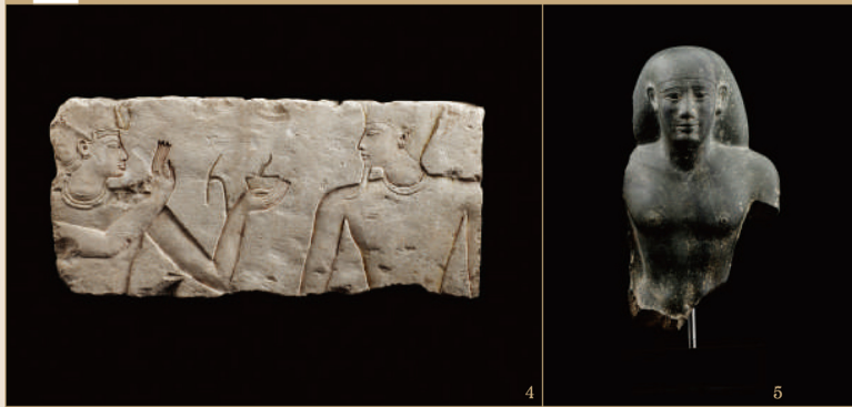
4.王とアトゥム神のレリーフ/第3中間期・第22王朝 5.役人の胸像/末期王朝時代・第26王朝