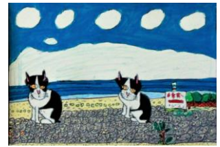
S6. 海とねこ (西須奈津子)