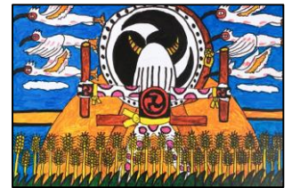
S2. 朱鷺と鬼太鼓の島・佐渡 (前田優作)