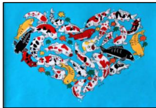
S3. 山古志の錦鯉たち ハートの形 (田中翠恵)