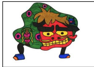
S4. 獅子舞 (堀井銀次)